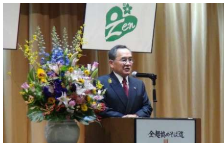
守田支部長の挨拶