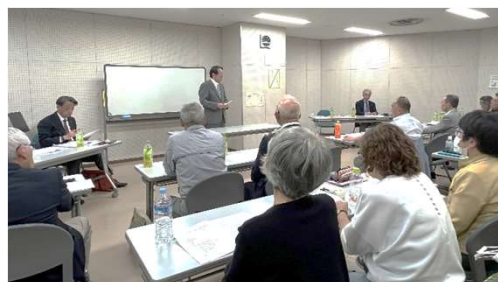
板倉副理事長の挨拶