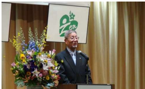
中谷理事長の挨拶