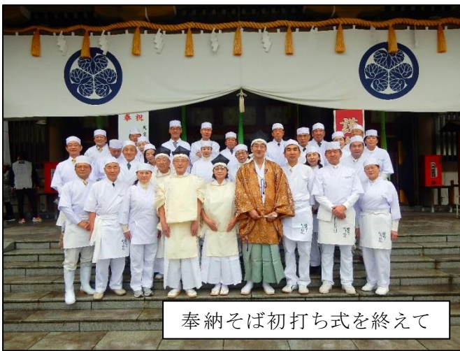
奉納そば初打ち式を終えて