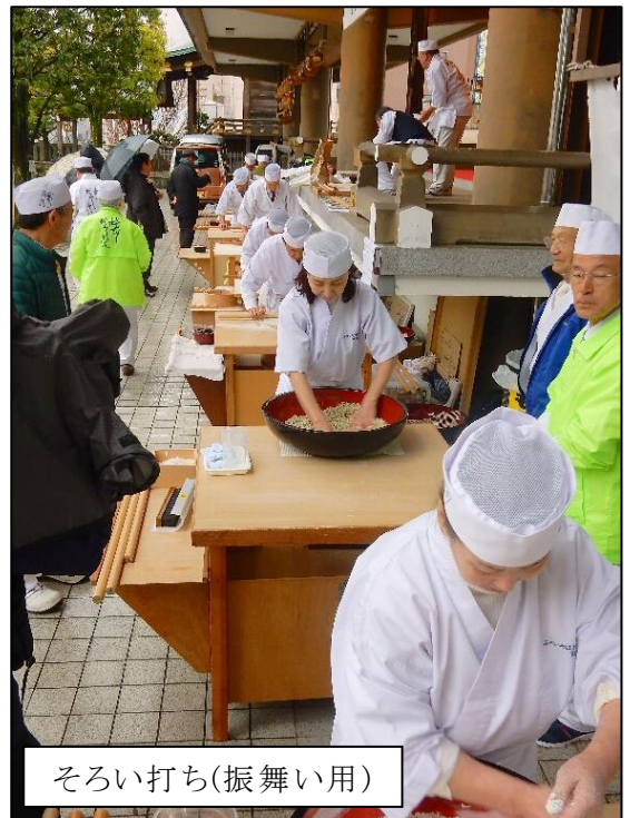
そろい打ち(振舞い用)