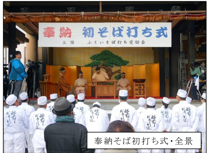
奉納そば初打ち式・全景